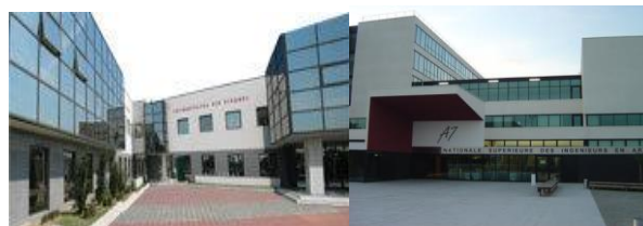
UNIVERSITATEA DIN PITEȘTI INP TOULOUSE