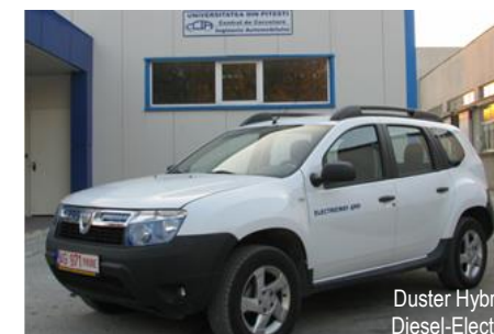
Duster Hybrid Diesel-Electric

Universitatea din Pitești Facultatea de Mecanică și Tehnologie Departamentul Autovehicule și Transporturi Str. Târgul din Vale nr.1, Corpul T Tel. 0348 / 453 150 http://www.upit.ro