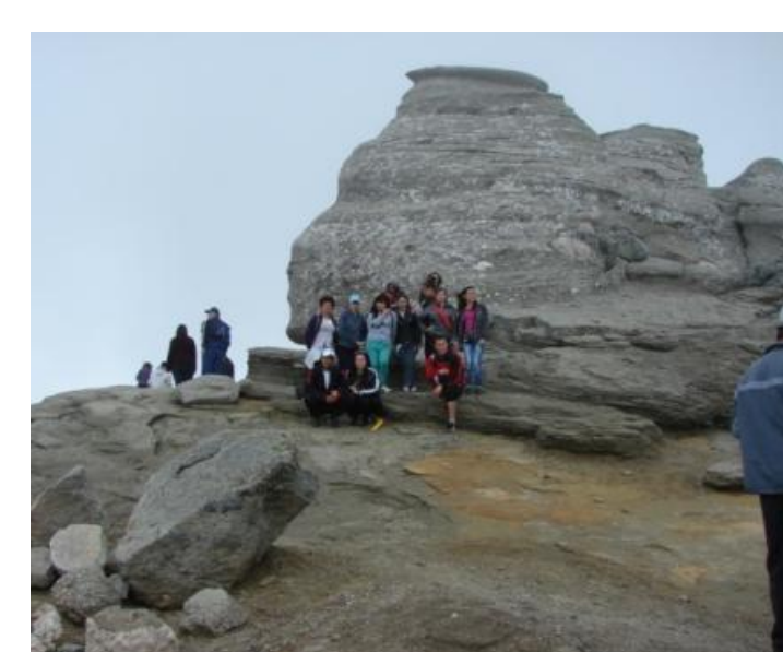
ÎN PRACTICĂ ÎN BUCEGI