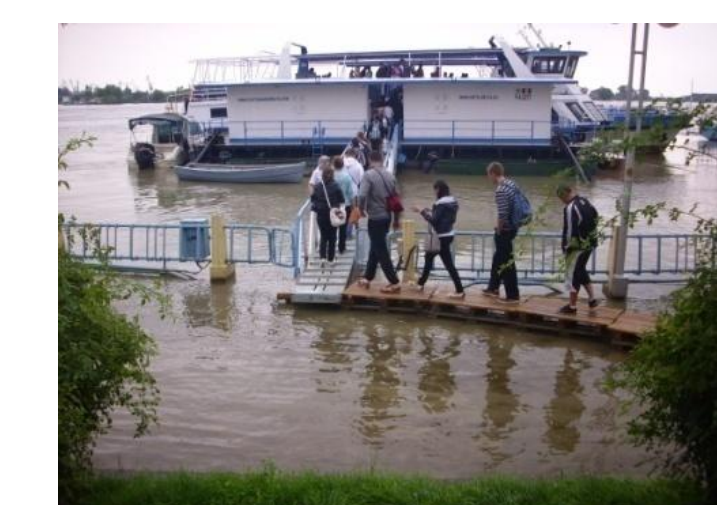
ÎN PRACTICĂ ÎN DELTA DUNĂRII