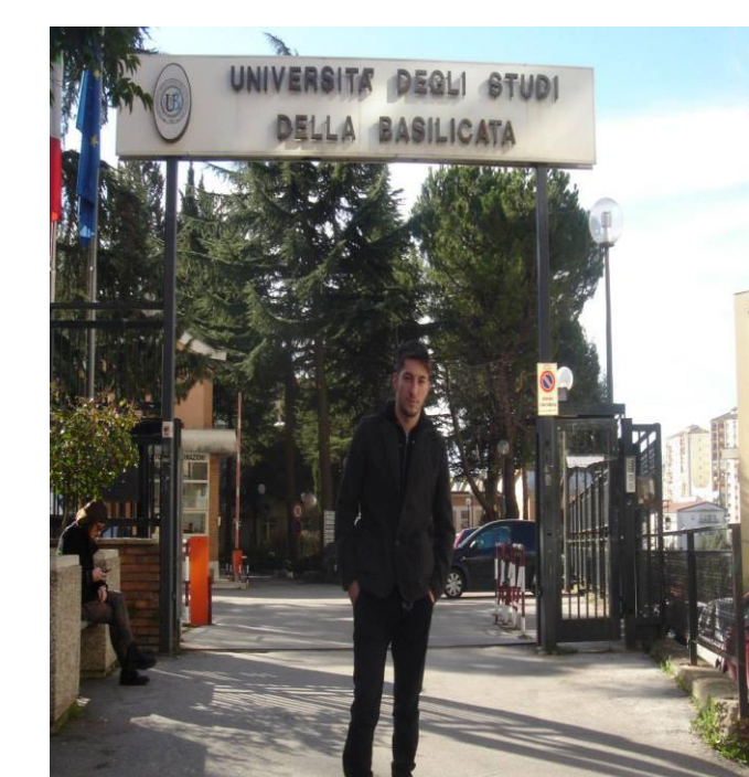
BURSE ERASMUS LA UNIVERSITATI EUROPENE