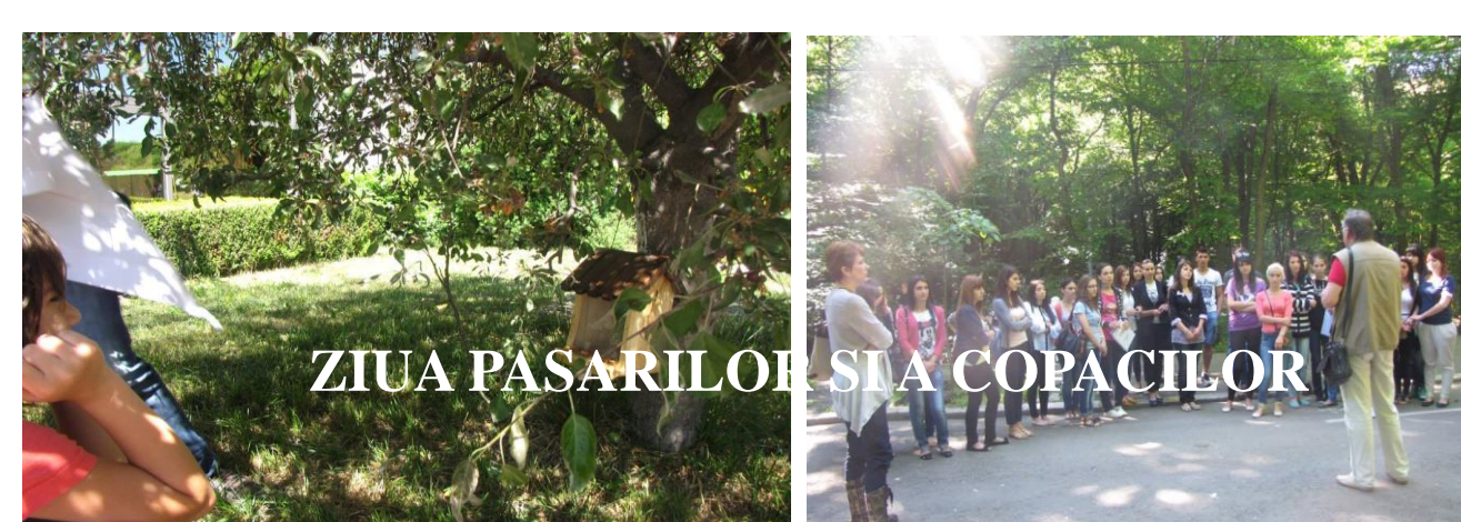
ZIUA PĂSĂRILOR ȘI A COPACILOR