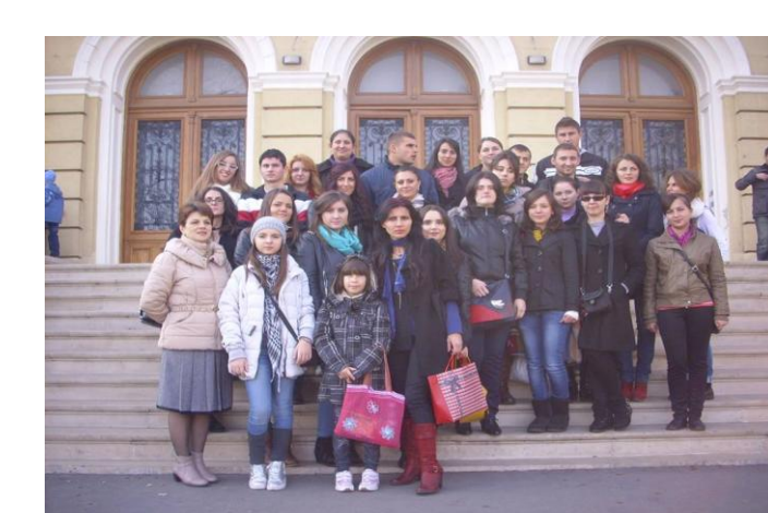
ZIUA INTERNAȚIONALĂ A STUDENTULUI 2013 LA MUZEUL NAȚIONAL DE ISTORIE NATURALĂ „GRIGORE ANTIPA”