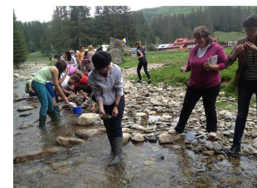
APLICAȚII ÎN TEREN

UNIVERSITATEA DIN PITEȘTI FACULTATEA DE ȘTIINȚE DEPARTAMENTUL DE ȘTIINȚE ALE NATURII SESIUNEA DE COMUNICĂRI ȘTIINȚIFICE A STUDENȚILOR ECOLOGIE ȘI PROTECȚIA MEDIULUI