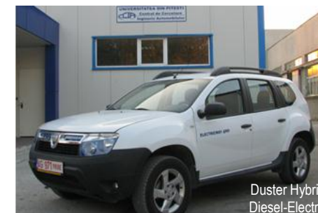
Duster Hybrid Diesel-Electric

Universitatea din Pitești Facultatea de Mecanică și Tehnologie Departamentul Autovehicule și Transporturi Str. Târgul din Vale nr.1, Corpul T Tel. 0348 / 453 150 http://www.upit.ro