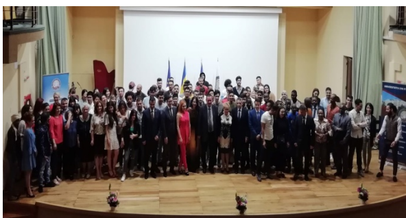
Ziua Studenților Internaționali - 7 iunie 2019