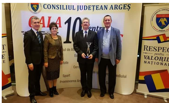
Gala "10 pentru Argeș"- decembrie 2017