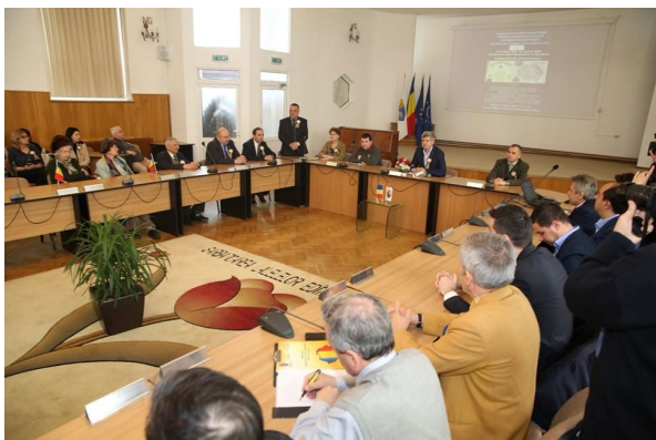
Centenarul Unirii Basarabiei cu România sărbătorit la Pitești - 27 martie 2018