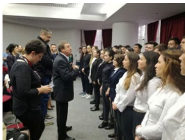
Ziua Europei – 9 mai 2017