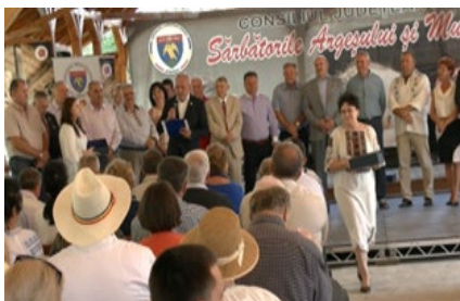
Sărbătorile Argeșului și Muscelului